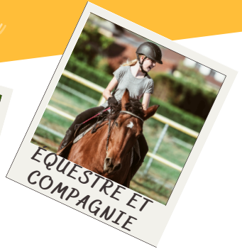
EQUESTRE ET COMPAGNIE