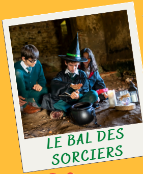
LE BAL DES SORCIERS