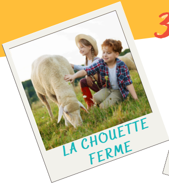
LA CHOUETTE FERME