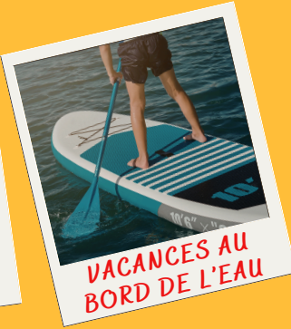
VACANCES AU BORD DE L'EAU