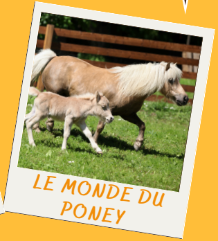
LE MONDE DU PONEY