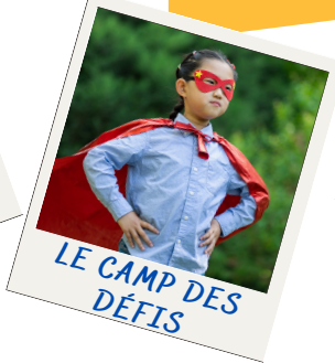
LE CAMP DES DÉFIS